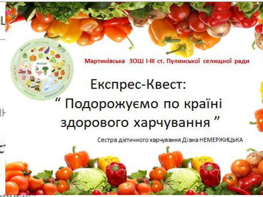
Мартинівська ЗОШ І-ІІІ ст. Пулинської селищної ради

АВТОР: НАТАЛІЯ ГАВРИЛЕНКО / ДАТА: 22.04.2021 / КАТЕГОРІЇ: БЕЗПЕКА ЖИТТЄДІЯЛЬНОСТІ ЗДОБУВАЧІВ ОСВІТИ, НОВИНИ, НОВИНОГОЛОШЕННЯ